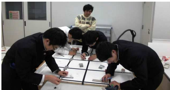
スロープも2日で完成しないと