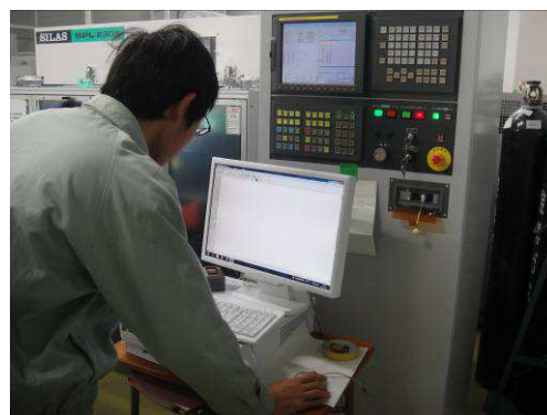
スロープはレーザー加工機で