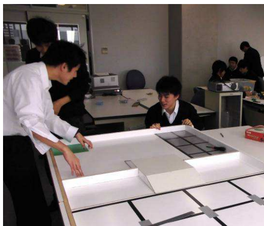
スロープを木ねじで固定