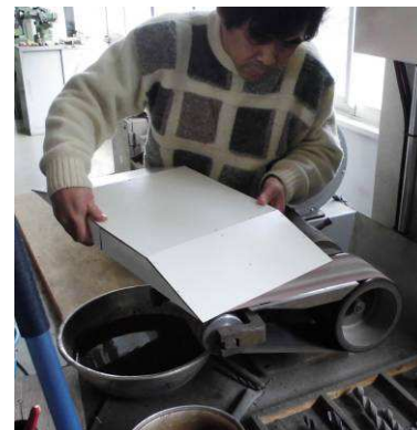
ベルトグラインダーで成形