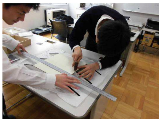
上板をエポキシと釘で固定