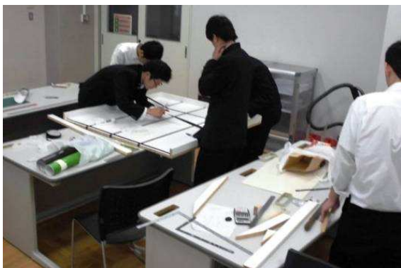
コース設営部隊を編成