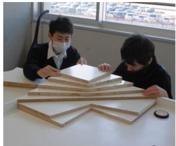
コース作りだけでも結構大変な課題です

一日中、コース作りをしましたが大変です。この後頂上の40ミリ角の穴をレーザー加工機でくり抜きます。でも、これを4個作ると思うとため息ばかりが出ますね。