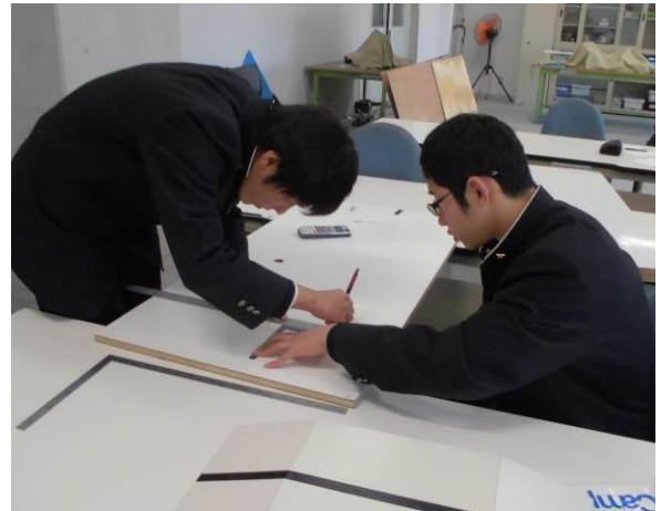
廃材を利用して図面書き