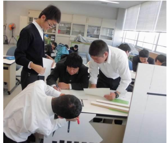
階段の図面書き出し