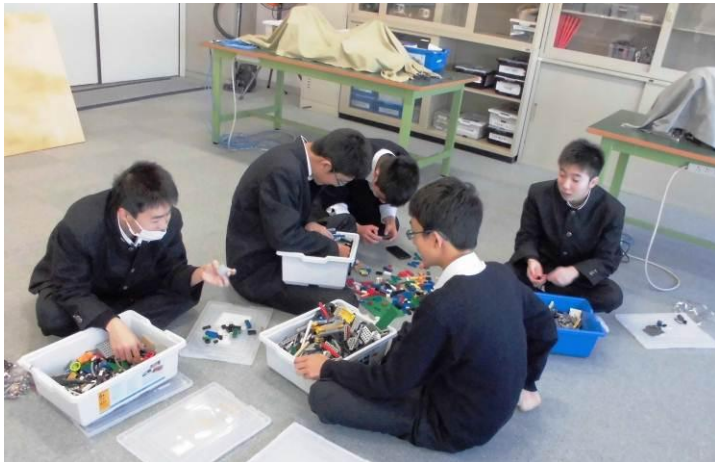
4色のブロックを選出