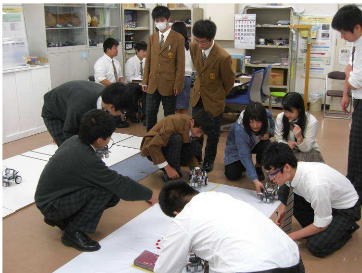
コースの障害物を避けて2m先のアヒルちゃんを救出します