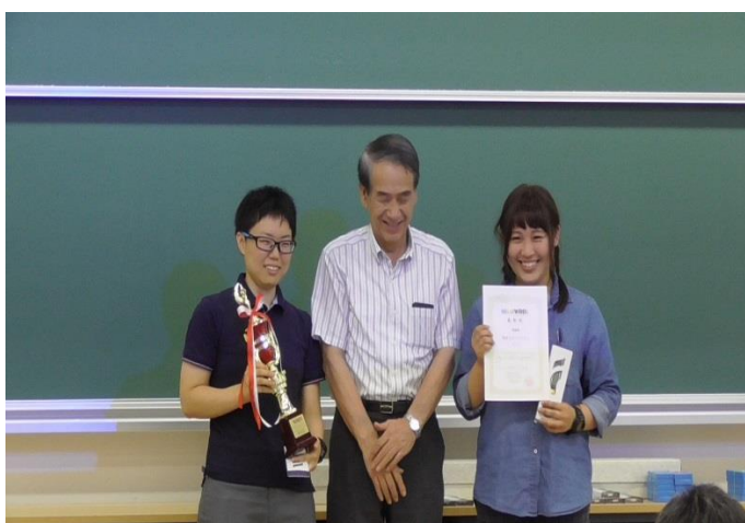
思わず笑みがこぼれるほど