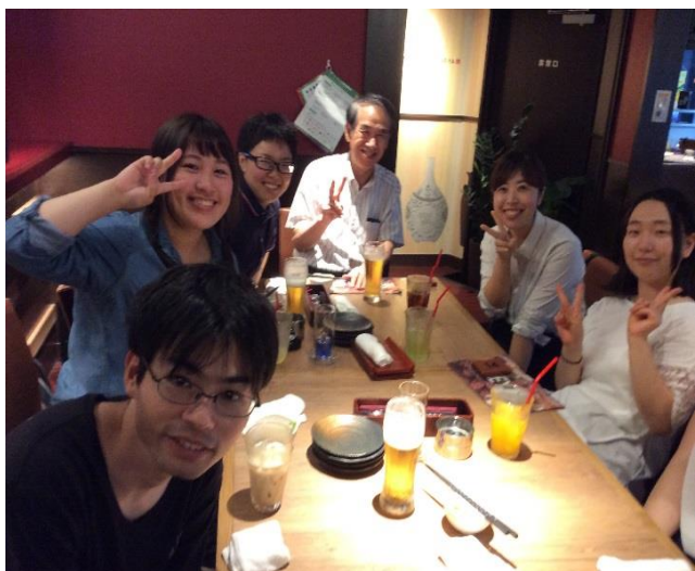
板橋からも参戦いただきました