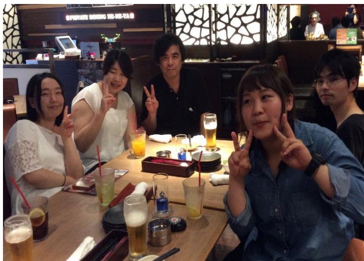
11月のニューデリー大会が楽しみ