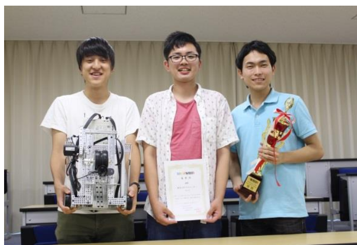
この調子で世界へ！！