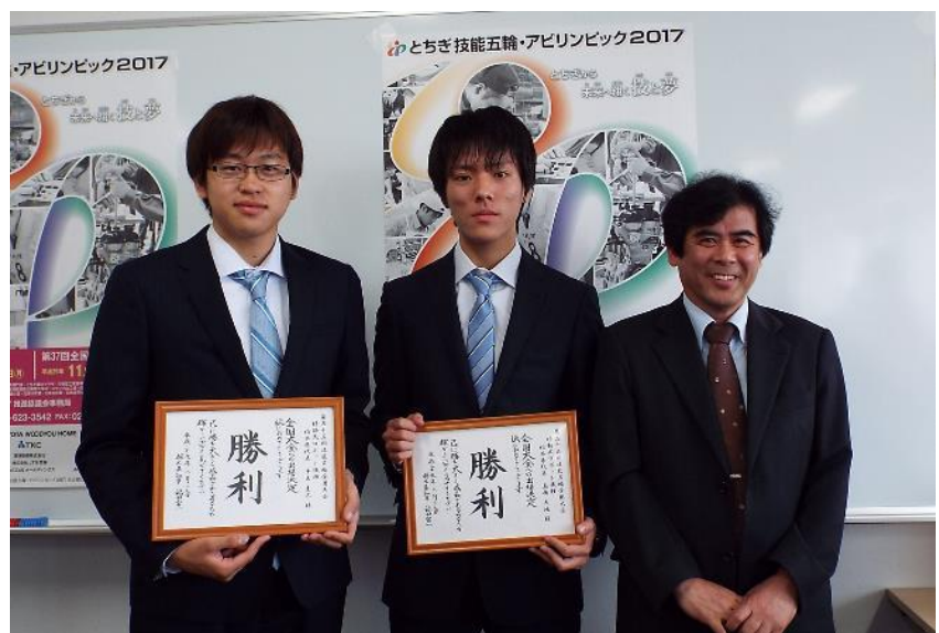
知事直筆の「勝利」と書かれた応援メッセージ