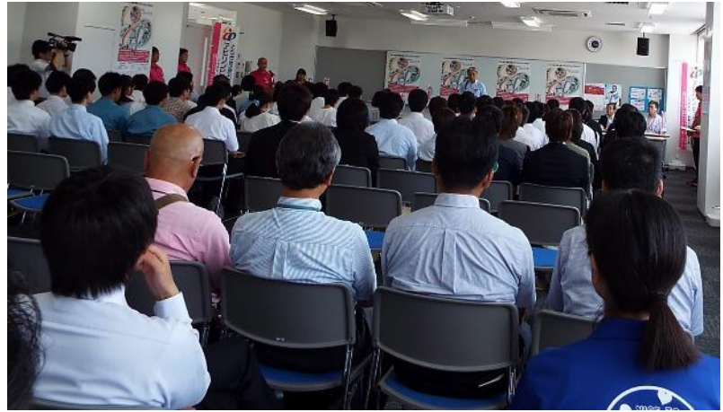
出場内定している171人の選手