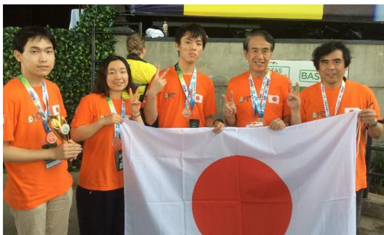
初日の高得点もあり、「3位」入賞しました。