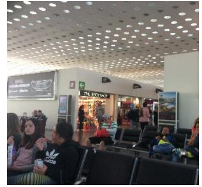
成田空港 メキシコシティまで13時間のフライト メキシコで9時間待ち