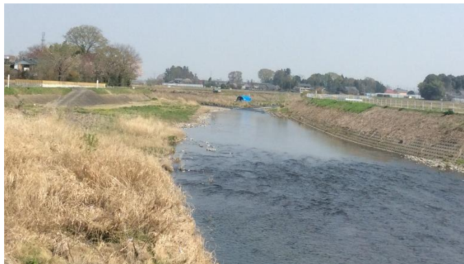
コメリ横で田川に合流する山田川