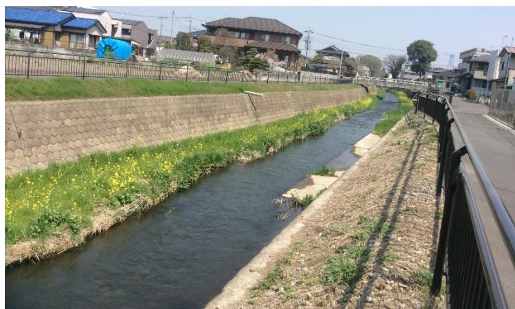
市街地を流れる御用川