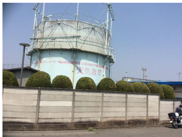
築瀬の汚水処理場