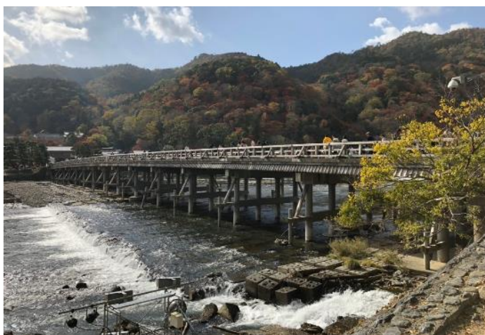
カーラさんご苦労様でした！！